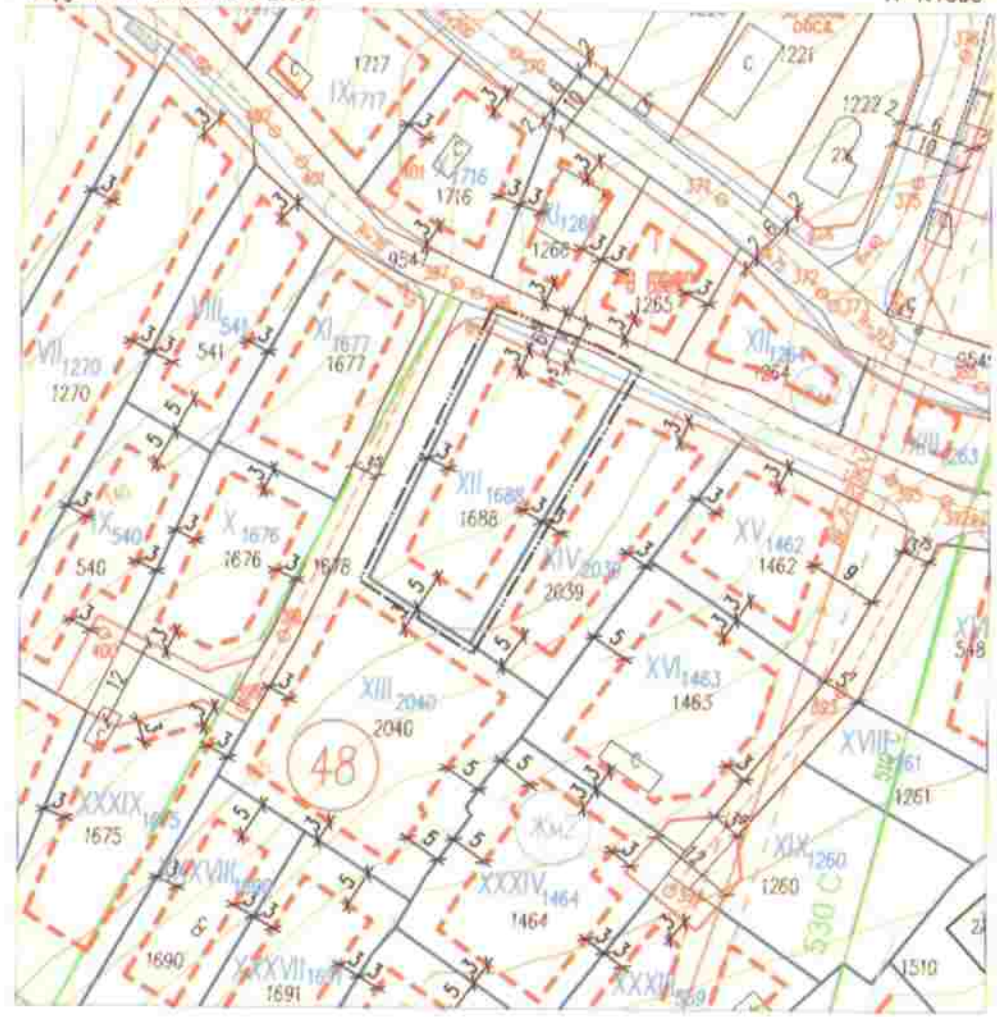
ПЛАН ЗА РЕГУЛАЦИЯ Координатна система БГС 2005г. М 1:1000