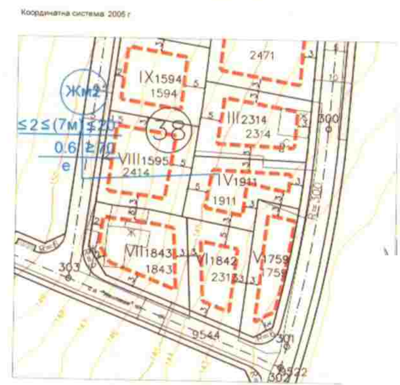
аблица с градоустройствени показатели