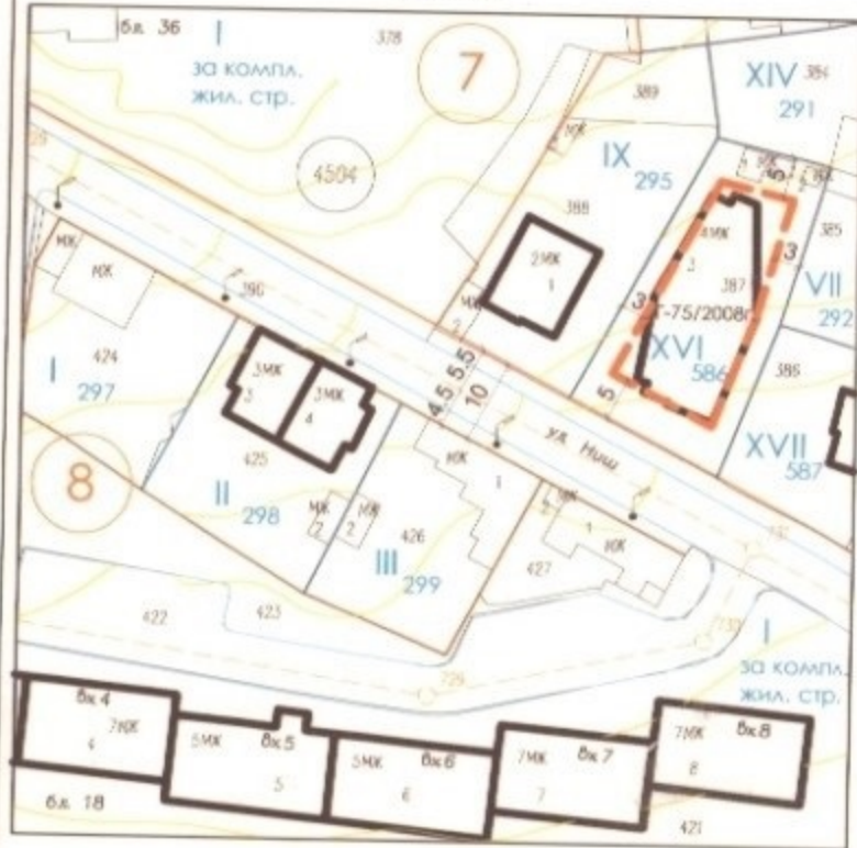
ПЛАН ЗА РЕГУЛАЦИЯ