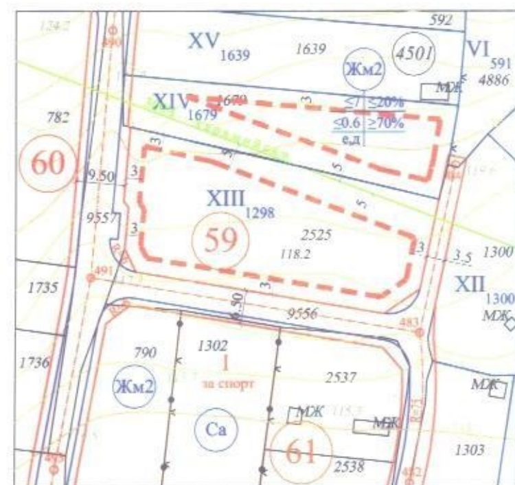
План за застрояване М 1:1000